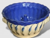
keramické bábovky - různé barvy