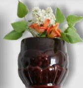
nádoba na květiny