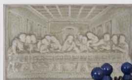
motiv poslední večeře páně