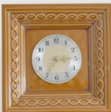
hodiny s kyvadlem